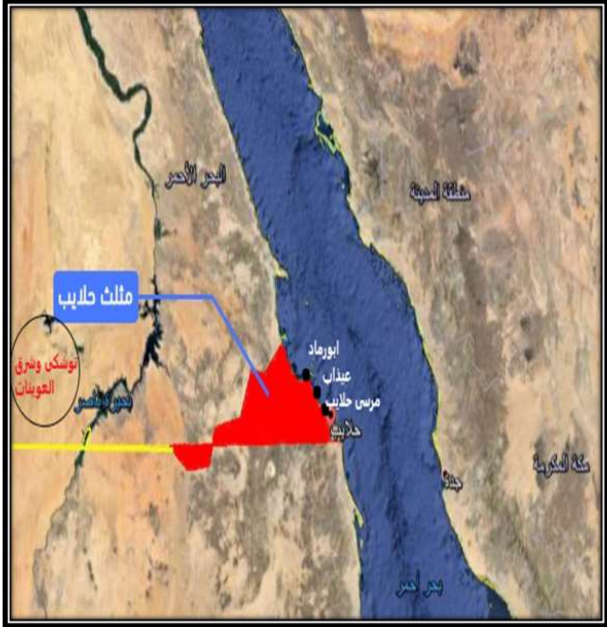
الشكل (2) : مواقع لموانئ مقترحة على ساحل مثلث حلايب وشلاتين